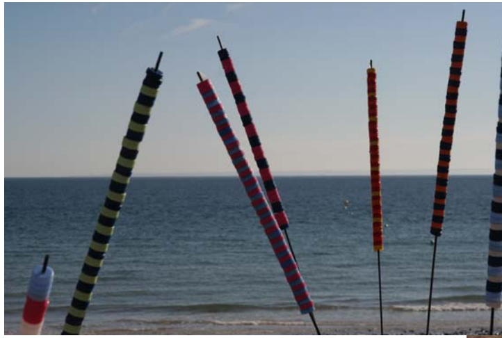
Vous avez vu la couleur de la mer et du ciel.