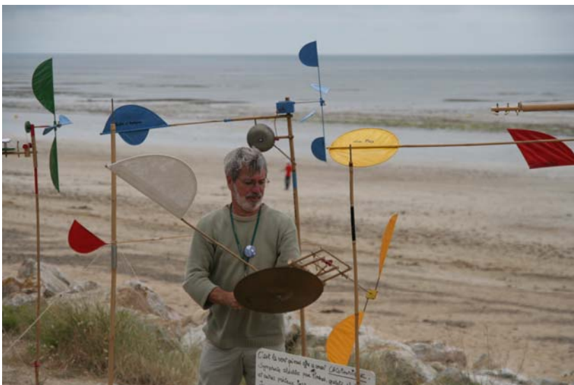
L'heure passe vite et il faut maintenant ranger au mieux pour retrouver le matériel à la prochaine sortie.