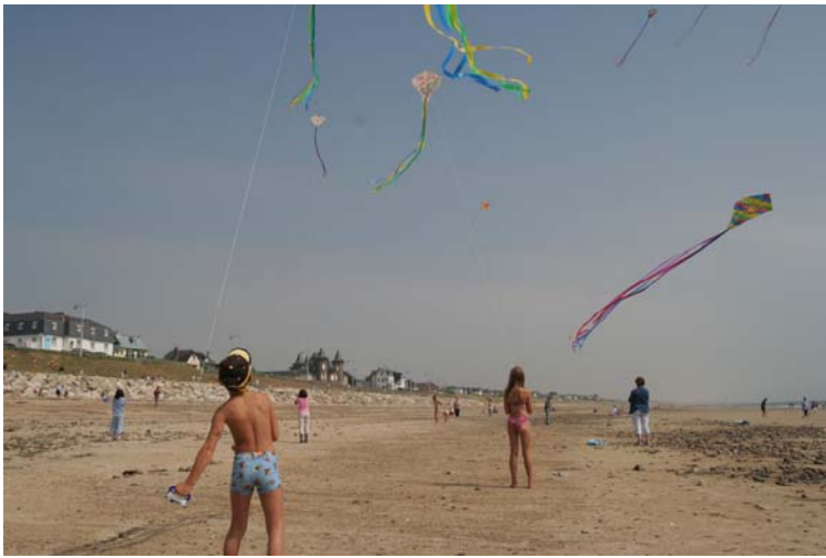
Les enfants prennent possession de la plage, c'est à leur tour de voler.