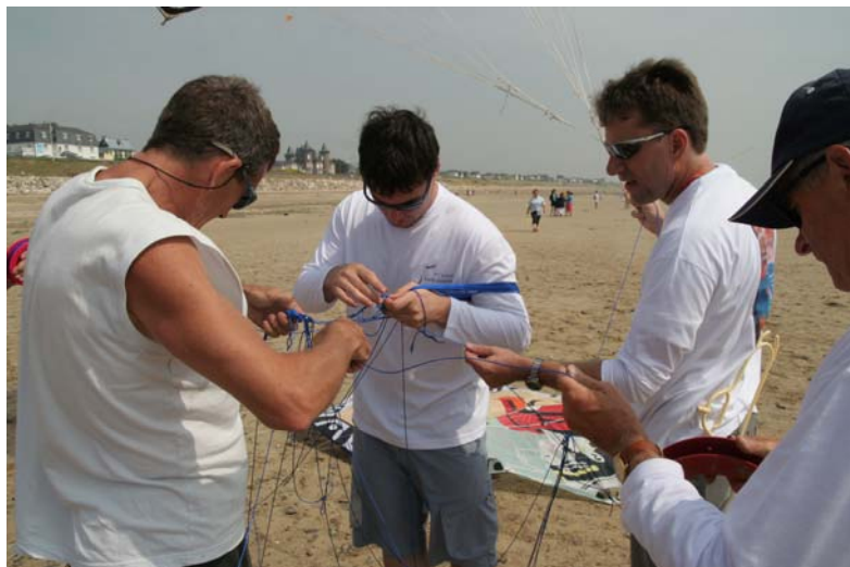
Reste à démêler les lignes.