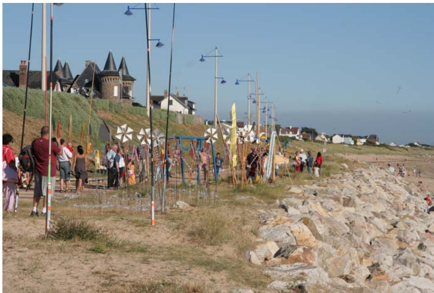
Le couloir du vent est planté sur la digue de rochers ( pas facile de planter entre deux gros cailloux ). Beaucoup de monde pour visiter et poser des questions.