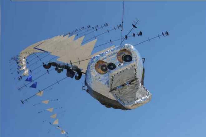
De la diversité dans les airs, des gros, des petits, des longs, des ronds, des triangles ...