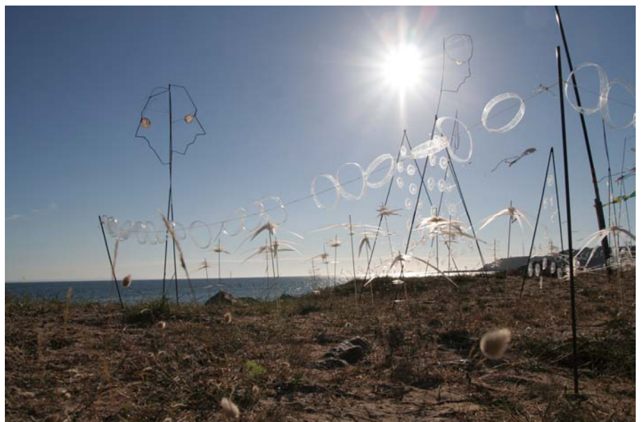
Le soleil décline et va laisser place à la nocturne. Hélas plus de vent, et les spectateurs sont là. Chaque cerf-voliste va donc tirer son volatile en traversant la plage pour le décoller un instant, en faisant cinq ou six essais chacun, nous aurons bien mérité les applaudissements.